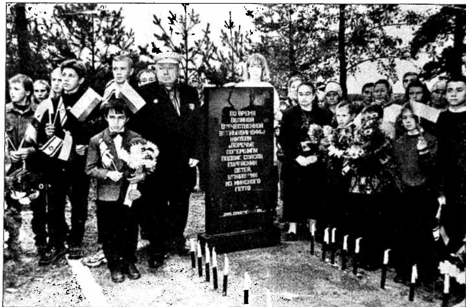
Открытие памятника в Поречье. 14 сентября 2000 г.

Потом по гетто разнесся слух, что на Юбилейной площади повесили евреев. Брат взял меня, и мы вдвоем побежали туда. Увидели: повешенных было человек десять. Мама висела на виселице самая первая. У нее были длинные-длинные черные волосы. Они развевались на ветру. Это был октябрь 1942 года. Стояли холодные дни. Мы с братом каждый день прибегали, думали, разрешат снять их. Не разрешали. А через три дня в Яму сбросили. На груди у повешенных были таблички с надписями, что их