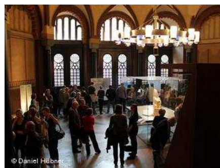
Открытие выставки в здании Новой